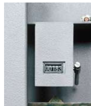
Le compteur et le scellé du foncet (en option): de précieux indices pour savoir si l'armoire a été ouverte en votre absence.