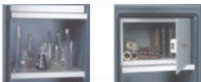
Equipements intérieurs (en partant de la gauche) : tablette, armoire à clé