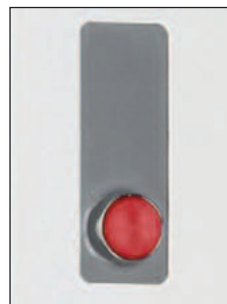
Bouton poussoir de sortie