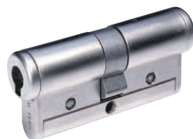
Cylindre européen VIGIE® (option)